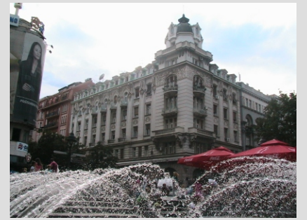
HOTEL RUSKI CAR