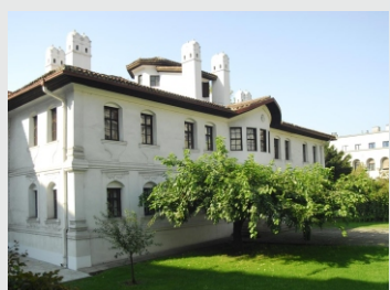
DVOREC (KONAK) KNEGINJE LJUBICE

Po zajtrku še ogled AVALE kjer stoji spomenik neznanemu vojaku, nekaj časa prosto za sprehod po Beogradu, v opoldanskih urah pa slovo in povratek proti domu. Doma bomo v večernih urah.