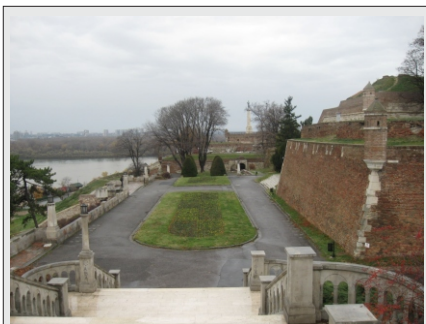
BEOGRAD - KALEMEGDAN

Program je pripravljen za vse tiste, ki še niste pozabili "naše YUGE" in za tisto generacijo, ki pa bi rada spoznala "naše včasih glavno mesto".