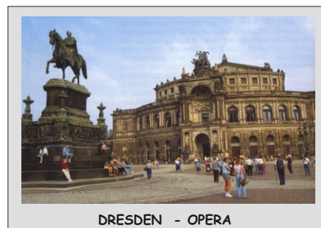
DRESDEN - OPERA

CENA vključuje: najsodobnejši prevoz z avtobusom (klima, video, hladilnik), stroške dveh voznikov, vse takse za ceste in parkiranja, DDV, 3 x polpenzion (večerja, nočitev in zajtrk) v hotelu 3*, osnovno nezgodno zavarovanje, stroške vodenja in agencije.