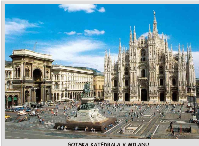
GOTSKA KATEDRALA V MILANU

139,00 € - pri udeležbi 35 - 39 potnikov