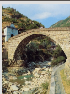
MOST V SAN MARTINU