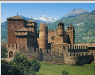
ČUDOVITI GRAD FENIS