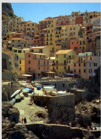
CINQUE TERRE - MONTEROSSO

Ligurska obala v Sredozemskem morju je v pokrajinskem pogledu nekaj posebnega, znamenite CINQUE TERRE pa še toliko bolj. Vasice so zgrajene tik nad morjem, druge na strmih pečinah, vse pa na nedostopnih pobočjih. Človeku jemlje dih že pogled na te kraje. Včasih si zaželiš, da bi tod ostal za vedno in se pomešal med številne ribiče, z njimi igral v pustih večerih briškolo, ali pa se v nedogled sprehajal po stezicah vklesanih v živo skalovje strmih pobočij. Tu se je življenje zaustavilo pred stoletji in tako bo teklo še naslednja stoletja, saj večina vasic nima niti cestne povezave. Edino ladje, čolni in vlak so v stiku z zunanjim svetom. Ostaja mir, lepota narave in seveda v sezoni množica turistov. Cinque Terre so naša uspešnica že nekaj let in prepričani smo, da bo tako tudi v naprej, saj čar vasic vabi tudi vas. V tem programu pa bomo spoznali še mesto Bologna in njegove znamenitosti.