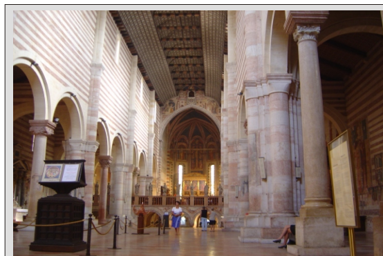
VERONA - CERKEV SV. ZENA

239,00 € - pri udeležbi 35 - 39 potnikov