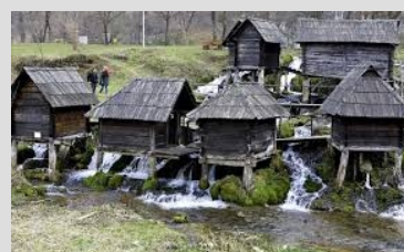
VODENICE NA PLIVI