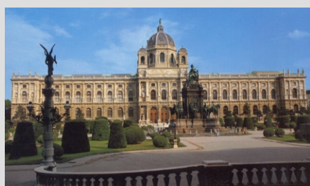
DUNAJ - TRG IN SPOMENIK MARIJE TEREZIJE

Predstavljamo vam zanimiv izlet, kjer boste spoznali dve prestolnici za katere radi rečemo, da sta najlepši v Evropi. Prvi dan si bomo ogledali DUNAJ, se zvečer sprehajali z vami po starem mestnem jedru ali pa se zabavali v Pratru, drugi dan nas čaka nadvse slikovita plovba s hidrokrilno ladjo po Donavi vse do glavnega mesta Madžarske - Budimpešte. Ogledi Pešte bodo na programu popoldne, večerja ob zvokih ciganske glasbe v Čardi, zadnji dan pa dopoldne ogled Budima in njegovih znamenitosti. Več kot zanimiv izlet za vse tiste, ki vam je "navaden" program premalo.