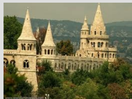
BUDIMPEŠTA - RIBIŠKA TRDNJAVA