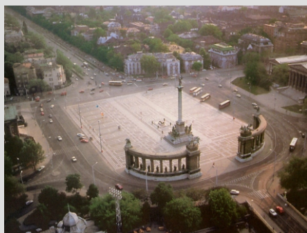
BUDIMPEŠTA - TRG HEROJEV