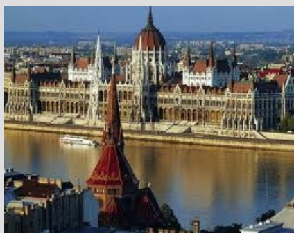
BUDIMPEŠTA - PARLAMENT