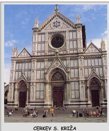
CERKEV S. KRIŽA

Firence so mesto renesanse, mesto številnih galerij in muzejev. So mesto umetnosti in ravno zaradi tega smo pripravili poseben program izleta za ljubitelje umetnosti. Mesto se namreč ponaša z največjo umetnostno galerijo v Italiji in eno največjih nasplih v svetu - UFFIZI. V svojih 45 sobah ponuja na ogled neprecenljivo vrednost umetnin 14., 15. in 16. stol., vodilnih avtorjev Italije, Holandije, Španije in Nemčije. Kljub visoki vstopnini se obisk poplača in zagotavljamo vam, da boste prevzeti ob pregledu ene največjih umetniških zbirk na svetu.