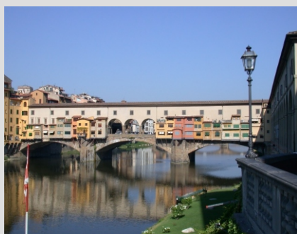
STARI MOST NA REKI ARNO

Po zajtrku odhod avtobusa v mesto. Priporočamo obisk GALERIJE UFFIZI. Tu boste lahko ves čas na ogledu izjemne zbirke slik številnih umetnikov vsega sveta ali pa bomo namenili čas za ogled ostalih znamenitosti mesta. Ob 15.00 bomo mesto zapustili, doma bomo pozno.