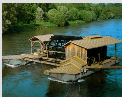
MLIN NA MURI