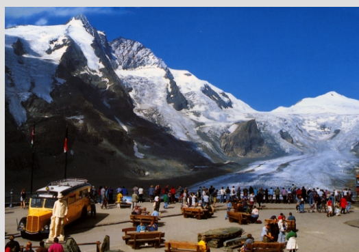
RAZGLEDNA PLOŠČAD IN LEDENIK PASTIRICA

VELIKI KLEK je slovensko ime za najvišjo goro Avstrije. Grossglockner - 3798 m je tudi izredno priljubljen cilj popotnikov in izletnikov iz vse Evrope. Privatna cesta vodi do razgledne ploščadi Franz Josefs Hohe (na sliki levo), od koder je ob lepem vremenu čudovit razgled na vrh gore in na ledenik Pastirica, ki je zadnji večji ledenik Evrope. Se izredno hitro topi in verjetno smo zadnja generacija, ki ga lahko občuduje.