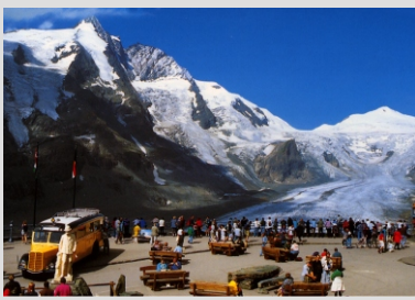
RAZGLEDNA PLOČAD IN LEDENIK PASTIRICA

Tokratni program je namenjen predvsem ljubiteljem planin in narave. Spoznali boste najvišji vrh Avstrije GROSSGLOCKNER (Veliki Klek), saj ga boste občudovali z znamenite razgledne ploščadi Franz Josefs Hohe , pod njo pa še ledenik Pastirica . Videli bomo še EDELWEI SPITZE , saj se bomo na višino 2577 m povzpeli tudi mi.