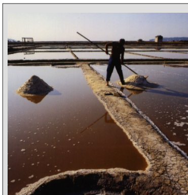
SOLINE - MUZEJ NA PROSTEM