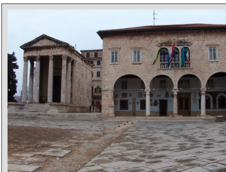
PULA - MESTNA HIŠA IN AVGUSTOVO SVETIŠČE

Pula ni samo veliko пристanišče, je namreč eno najlepše ohranjenih rimskih mest na Hrvaškem in obisk vseh teh izjemen spomenikov pretekle zgodovine je nekaj posebnega. Slovo od mesta in vožnja do bližnjega mesteca VODNJAN za ogled cerkve Sv. Blaža. Za ta dan bo to kar precej ogledov in prav prijetno bo posedeti v katerem od prijetnih gostišč na našem povratku (večerja ob doplačilu). Istra bo ostala v prijetnem spominu.