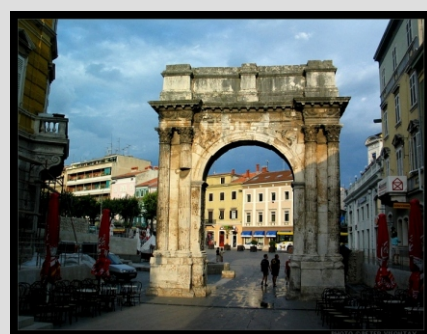
PULA - SLAVOLOK SERGIJEVCEV