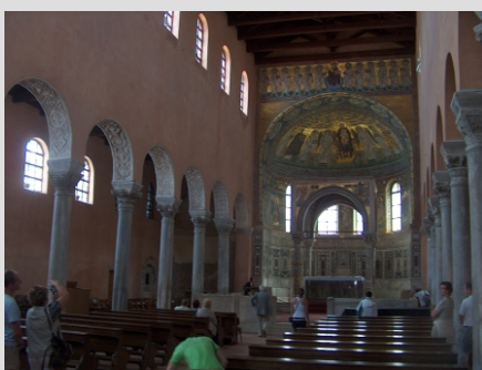
POREČ - EVFRAZIJEVA BAZILIKA