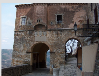
MOTOVUN - MESTNA VRATA

Hrvaška Istra je prava zakladnica bogate zgodovine, izjemne arhitekture, čudovitih obmorskih mest, izjemnih cerkva, najboljših malvazije in seveda odlične kulinarike.