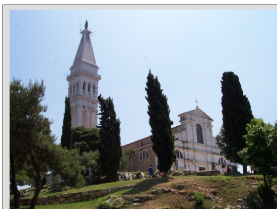
ROVINJ - CERKEV SV. EVFEMIJE

Cena vključuje, avtobusni prevoz, vse takse za ceste in parkiranja, 1 x polpenzion (večerja, nočitev in zajtrk) v hotelu 3*, DDV, osnovno nezgodno zavarovanje, vodenje in organizacijo. DOPLAČILO za stroške ladjic in vstopnin.