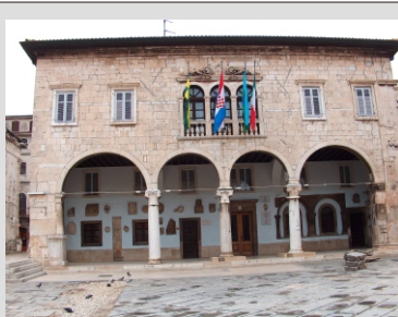
PULA - MESTNA HIŠA