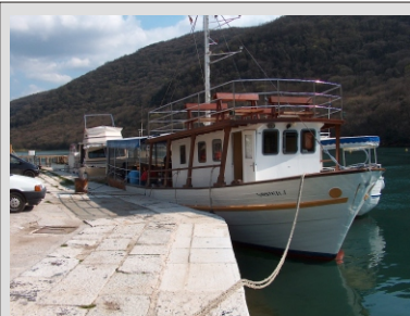
NAŠA LADJA V LIMSKEM FJORDU

Po zajtrku slovo od mesta Rovinj in vožnja proti FAŽANI. Ob 10.00 vkrcaje na ladjo ki nas bo popeljala na BRIJONE. Po izkrcaju se bomo podali na ogled VELIKEGA BRIJONA v spremstvu lokalnega vodnika. Vozili se bomo z vlakcem in se seveda sprehajali po prelepo urejeni okolici med stoletnimi oljkami in borovci. Po vrnitvi na kopno še vožnja do PULE kjer si bomo ogledali najlepše staro mestno jedro v Istri: ARENO, HERKULOVA VRATA, SLAVOLOK SERGIJEVCEV, MESTNO HIŠO in KATEDRALO. Po ogledih vožnja do doma kamor bomo prispeli v poznih urah.