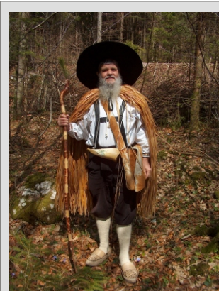
EDEN NAŠIH LOKALNIH VODNIKOV

FRANČIŠKANSKI SAMOSTAN je posebnost mesta. Ustanovljen je bil leta 1495, leta 1627 pa je bila ustanovljena knjižnica, ki danes obsega 10.000 dragocenih knjig. Najbolj znan eksponat knjižnice pa je Biblija Jurija Dalmatina iz leta 1584.