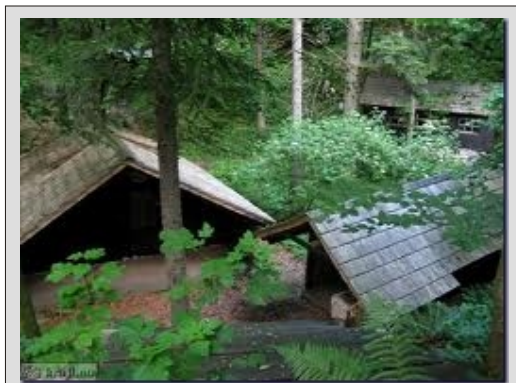
BAZA 20 - KOČEVSKI ROG

Zadnji del dneva se bomo vozili po dolini reke Krke mimo Žage in Žužemberka. Na povratku proti domu se lahko zaustavimo za večerjo v katerem od številnih gostišč, ki jih je tod kar precej. Doma bomo v poznih večernih urah.