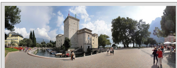
RIVA DEL GARDA

149,00 € - pri udeležbi 35 - 39 potnikov