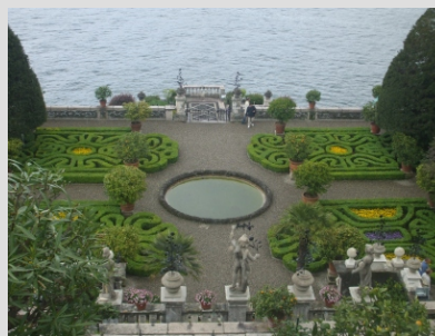
PARK NA OTOKU ISOLA BELLA