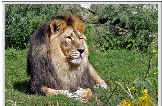
VOŽNJA MED LEVI BO PRAVO DOŽIVETJE

CENA vključuje: najsodobnejši prevoz z avtobusom (klima, video, hladilnik), vse takse za ceste in parkiranja, DDV, 1 x polpenzion (večerja, nočitev in zajtrk-namestitev v dvoposteljnih sobah, tuš,wc) v hotelu 3*, stroške vodenja in agencije.