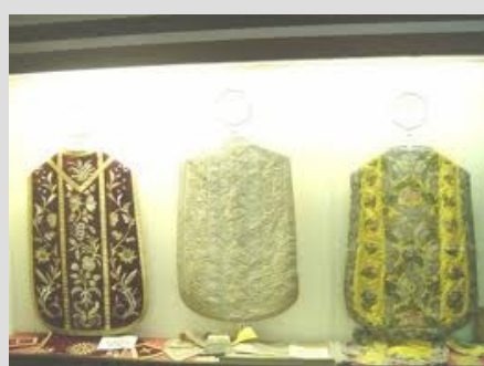
MAŠNI PLAŠČI V RADMIRJU