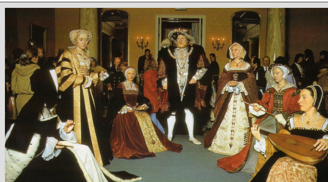
MUZEJ VOŠČENIH FIGUR - KRALJ HENRY VIII.

CENA vključuje: letalski prevoz na liniji Brnik - London - Brnik, vse letališke in varnostne takse, DDV, transfer z letališča v Londonu do hotela in nazaj, strošek panoramskega ogleda mesta, namestitev v hotelu 3*** (dvo-posteljne sobe) na bazi 2 x nočitev in zajtrk, 2 x večerja v restavraciji v mestu, strošek našega vodiča in agencije.