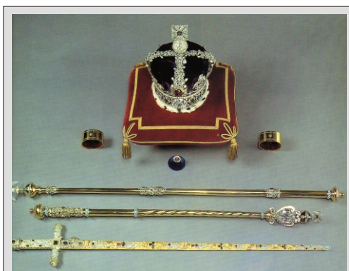
ZBIRKA KRONSKIH DRAGULJEV

499,00 € - pri udeležbi 45 - 48 potnikov