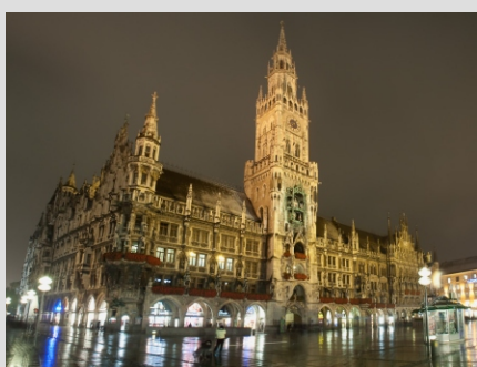
MUNCHEN - MESTNA HIŠA

Munchen je kot prestolnica Bavarske s svojim starim mestnim jedrom vedno dobrodošel cilj svetovnih popotnikov. Mi vam poleg ogledov nudimo še obisk največjega muzeja tehnike na svetu, kjer si boste lahko ogledali razvoj tehnike od daljne zgodovine do danes na izjemno pregleden način. Tu so razstavljena letala, rakete, ladje, rudniška oprema, različni laboratoriji in številne makete ter pravi rudnik.