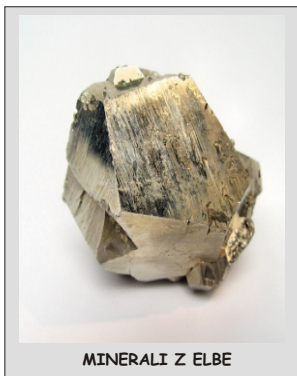
MINERALI Z ELBE

OTOK ELBA je posebnost te pokrajine. Čudovite plaže, razgibana obala in visoki gorski masivi si kar podajajo roke. Minerali in poldragi kamni z tega otoka pa so tako in tako znani po vsem svetu. Obiskali bomo eno od brusilnic in se popeljali z vlakcem po namišljenem rudniku, videli pa bomo tudi Napoleonovo vilo, San Martino, saj je Napoleon tu preživel kar devet mesecev v izgnanstvu. Elba pa ponuja tudi čudovito panoramsko vožnjo, ki se ponekod dviga visoko nad morjem, drugod pa tik ob čudoviti obali.