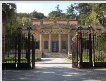
ELBA - VILA SAN MARTINO