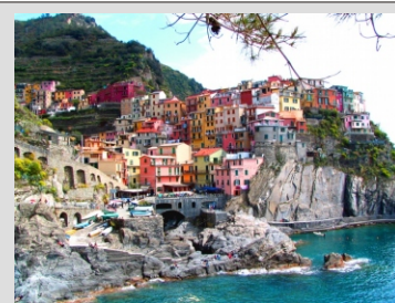
CINQUE TERRE - MANAROLA