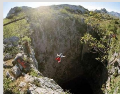
SKOK V "PEKEL"