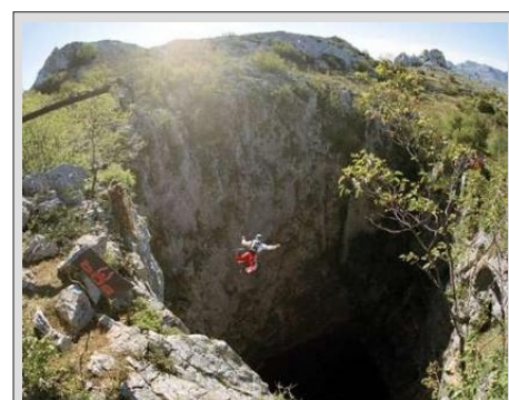
PEKEL - IME PAKLENICA LE NI KAR TAKO

CENA vključuje: prevoz z najsodobnejšim avtobusom turistične kategorije, vse takse za ceste in parkiranja, DDV, 1 x polpenzion (večerja, nočitev in zajtrk) v hotelu 3***, osnovno nezgodno zavarovanje, strošek vodiča in agencije.