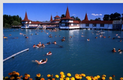
TERMALNO JEZERO HEVIZ

Po zajtrku najprej kratek postanek v mestu ZALAEGRSZEG za ogled največjim znamenitosti, nato pa do mesta SZENTGOTTHARD (Monošter), ki je osrednje naselje Porabja kratek postanek za ogled, imeli pa bomo tudi srečanje z KUD Monošter, katerega predhodnik je društvo LIPA. Predstavili nam bodo življenje in običaje tamkajšnjih prebivalcev. Lahko vam organiziramo srečanje z mešanim pevskim zborom imenovan po Franzu Lisztu. Sledi kosilo in nato povratek proti Ljubljani kjer bomo v večernih urah.