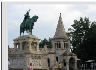
KRALJ ŠTEFAN NA KONJU

Po zajtrku se bomo posvetili ogledom mesta. Prvi del bomo namenili PEŠTI in si ogledali: TRG HEROJEV in njegov veličastni spomenik, ter UMETNOSTNI in ETNOGRAFSKI MUZEJ, se sprehodili v mestni park in tam občudovali GRAD VAJDAHUNJADY. Naslednji postanek bo v centru mesta, sprehod po najbolj znameniti ulici mesta VATCI s številnimi trgovinami in prijetnimi lokali. Bolj podrobno pa sledijo ogledi: ŠTEFANOVO CERKEV in OPERO, PARLAMENT, se sprehodili preko VERIŽNEGA MOSTU do "nulte točke Madžarske". Od tu se bomo popeljali z zobato železnico na Grajski grič. Popoldanski del dneva bomo tako preživeli na območju BUDIMA: RIBIŠKA TRDNJAVA, MATJAŽEVA CERKEV, ulica TARKOK z Kužnim znamenjem, MESTNA HIŠA, PALATINOVA PALAČA (danes vojaški muzej), DRŽAVNI ARHIV. Zadnji del dneva bomo preživeli na območju GRADU. Številni muzeji in seveda izjemni razgled na mesto pod seboj. Tu bo tudi slovo ob Madžarske prestolnice. Odhod proti domu, vožnja ob Blatnem jezeru in preko Dolge vasi, Murske Sobotke do doma.