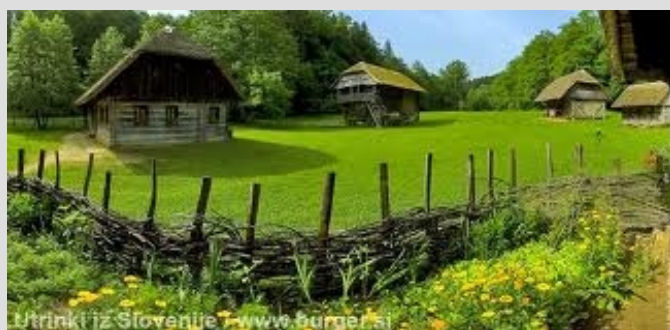
PLETERJE - MUZEJ NA PROSTEM