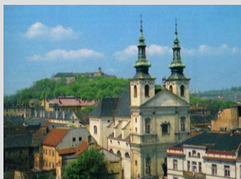
BRNO IN GRAD ŠPILBERK V OZADJU

Po zajtrku se bomo odpravili nazaj in se na naši poti proti domu zaustavili v glavnem mestu Moravske - BRNO. Ogledali si bomo TRG SVOBODE, STOLNICO in v nadaljevanju še GRAD ŠPILBERK. Čas bo tudi za obisk botaničnega vrta in kosilo. V popoldanskih urah vožnja preko Bratislave do doma.