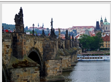
PRAGA - KARLOV MOST

PRAGA - prestolnica Češke velja za eno najlepših mest v Evropi. Izjemno bogata zgodovina je pustila sledove na vsakem koraku. Zgradbe iz posameznih obdobji stojijo ena ob drugi, od meščanske hiše do baročne palače, od secesijske stavbe do kubistične kavarne. Prava paša za oči in duha pa je reka Vltava, ki leno teče skozi mesto.