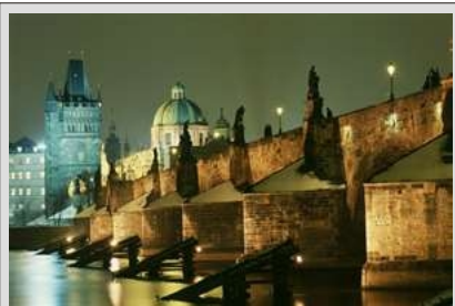
PRAGA - KARLOV MOST

PRAGA je zaradi bogate zgodovine in izjemne arhitekture vedno priljubljen cilj svetovnih popotnikov. Sprehod po starem mestnem jedru, preko Karlovega mostu, ki se tako prefinjeno pne nad Vltavo je seveda cilj našega ogleda. Tudi Hradčane ne bomo pozabili in tako zaokrožili vse najlepše predele mesta. JUŽNA ČEŠKA je brez dvoma najlepši predel Češke. Življenje "teče" ob čudoviti Vltavi in vsi večji kraji so postavljeni ob tej mirni reki, ki jim čudovito daje svoj pečat. Pripravili smo obisk gradov in mest: HLUBOKA, ČEŠKE BUDEJOVICE, ČEŠKI KRUMLOV in ROŽMBERK.