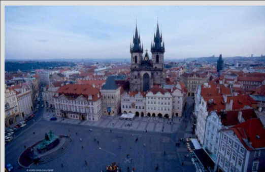
PRAGA - STARO MESTO

Po zajtrku se bomo poslovili od "zlate Prage". Vožnjo proti domu bomo prekinili v mestecu TELČ, ki je pravi arhitekturni biser. Velja za najbolj urejeno in slikovito mesto na Češkem in obiskovalcu se ob prvem obisku zdi lepota mesta skoraj neverjetna. Grad in staro mestno jedro sta resnično nekaj posebnega in časa za podroben ogled bo vsekakor premalo. Tu bo tudi čas za opoldanski odmor in kosilo. V popoldanskem času nadaljevanje proti domu kjer bomo v poznih večernih urah.