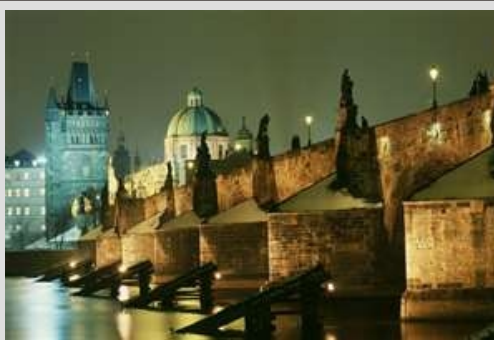
PRAGA -KARLOV MOST