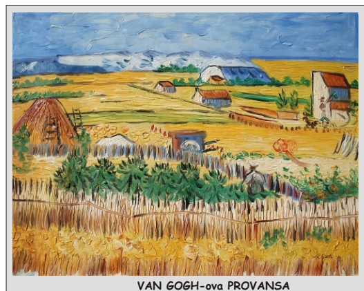
VAN GOGH-ova PROVANSA

CENA vključuje: prevoz z avtobusom (klima, video, hladilnik), vse takse za ceste in parkiranja, DDV, 2 x nočitev in zajtrk (dvoposteljne sobe, tuš, wc) v hotelu 3*, osnovno nezgodno zavarovanje, stroške vodenja in agencije.