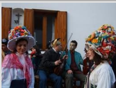
REZIJANSKA NARODNA NOŠA