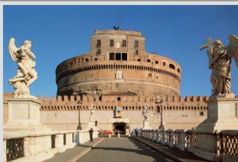
RIM - ANGELSKI GRAD IN MOST

Po zajtrku se bomo odpravili v mesto na ogled: STARI MOST na reki Arno, GALERIJA UFFIZI, GOSPOSKI TRG, CERKEV SV. KRIŽA (tu so pokopani najpomembnejši meščani - brez vstopnine), STOLNICA in KRSTILNICA. Nekaj časa prosto tudi za okrepčilo in samostojne ogleda, ob 15.00 uri pa odhod proti domu kjer bomo ob 23.00 uri.