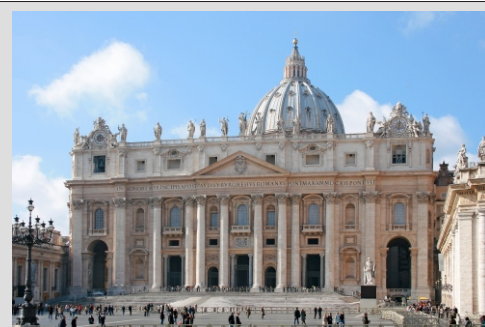
RIM - BAZILIKA SVETEGA PETRA