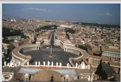
RIM - PETROV TRG

Dokaj zahteven izlet, vendar za prave ljubitelje zgodovine in čudovite italijanske pokrajine to ne bo nikakršen napor. Spoznali boste namreč večno mesto RIM, se sprehodili po mestu NEAPELJ, obiskali vulkan VEZUV, spoznali skrivnost POMPEJEV, se čudili lepotam otoka CAPRI in se za konec spočili ob Amalfski obali. Naš vodnik vam bo v teh dneh odlično predstavil bogato zgodovino Italije in vam razkril marsikatero skrivnost te lepe dežele.