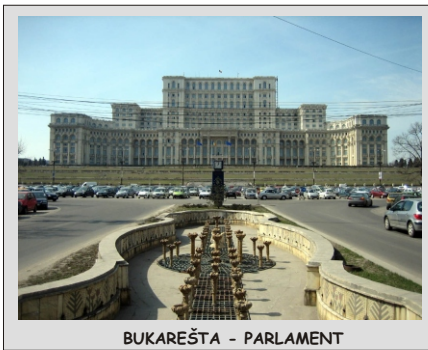
BUKAREŠTA - PARLAMENT

Romunija ponuja kar precej pester izbor ogledov. Poleg glavnega mesta Bukarešta, ki premore preko tisoč muzejev, galerij, gledališč in drugo največjo stavbo na svetu – Parlament z preko 1.100 dvoran in sob, bomo spoznali tudi druga mesta v tej državi: Sinaia, Braslov, Sighisoara in Sibiu. Ob naši poti v Romunijo pa še Beograd. Pot bo dolga preko 2.000 km, videli pa bomo najlepša mesta in izjemne gradove v Transilvaniji.