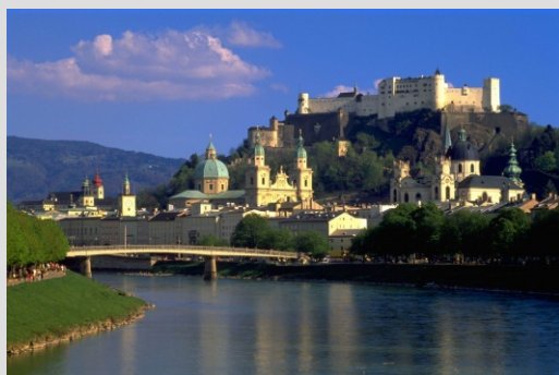
SALZBURG - GRAD

Domov bomo prispeli v poznih večernih urah.