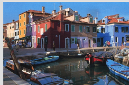
SLIKOVITI OTOK BURANO

129,00 € - pri udeležbi 35 - 39 potnikov