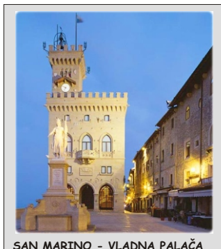
SAN MARINO - VLADNA PALAČA

San Marino je posebnost med "žepnimi državami". Njena tisočletna zgodovina je zelo zanimiva in obisk "državice" na gori Titano je skoraj obvezen del naše ponudbe. Štiri trdnjave in čudovit razgled z vrha na okolico, čudovite stavbe zgrajene ob ozkih in strmih ulicah, številni muzeji in cerkve vas bodo navdušili. Navdušeni pa boste tudi nad ponudbo po brezštevilnih trgovinah mesta, saj San Marino velja za brezcarinsko cono. Kljub temu, da je monetarno in vojaško vezan na Italijo, ima ta državnica svojo vojsko, denar, znamke in tudi samostojnost. Ima celo svojo nogometno in lokostrelsko reprezentanco in še marsikaj zanimivega. Na tem izletu pa boste videli še stari del mesta Rimini, zvečer pa se zabavali v kateri od številnih diskotek v mestu, zadnji dan pa spoznali Raveno, ki slovi po bizantinskih mozaikih.