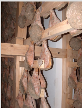
V PRŠUTARNI LOKEV