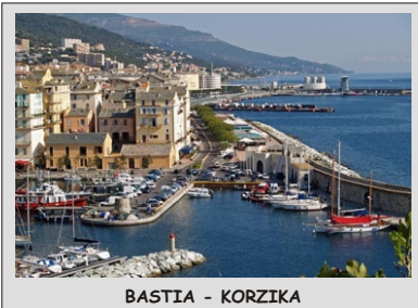
BASTIA - KORZIKA

Tokrat vam predstavljamo "Sredozemski trojček", torej tri najlepše otoke v Sredozemskem morju. KORZIKA se ponaša z izjemno lepimi plažami, visokimi gorami in čudovitimi rečnimi dolinami. Posebnost so tudi calanche, ki so prava igra narave. SARDINIJA je znana po najlepših plažah, SICILIJA pa velja za najlepši otok od vseh treh. Presojimo bomo prepustili vam, vi pa nam prepustite, da vas popeljemo po lepotah otokov, vam razkažemo najlepše predele, vas razvajamo z odlično hrano in vam predstavimo lokalna vina v izbranih vinskih kletah.