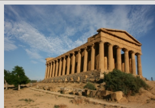
SICILIJA - AGRIGENTO