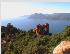
KORZIKA - CALANCHE

V jutranjih urah izkrcanje v Neaplju in nato vožnja po AC skozi Nacionalni park GRAND SASSO, ki ponuja prečudovite prizore in slikovito vožnjo. Vozili se bomo nato ob Jadranski obali, mimo Ancone, Bologne in Benetk do doma.