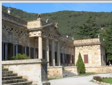
ELBA - NAPOLEONOVA VILA