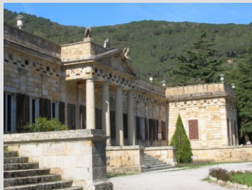
ELBA-VILA SAN MARTINO