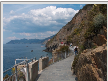
CINQUE TERRE-POTKA LJUBEZNI