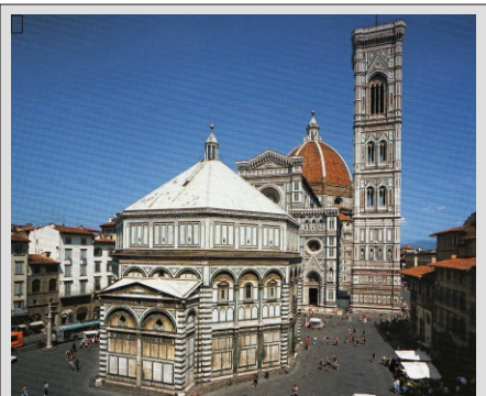
FIRENCE - KRSTILNICA IN KATEDRALA

TOSKANA je brez dvoma najlepša pokrajina Italije. Razgibani grički polni vinogradov in oljčnih nasadov, obsežna polja sončnic, prijetni hoteli, izjemna stara mestna jedra čudovitih mest, odlična hrana in najboljša vina - to je Toskana in tako bi vam radi predstavili. Firenze, Siena, San Gimignano in Volterra ter še Pisa in Lucca, so mesta na naši poti ogledov.