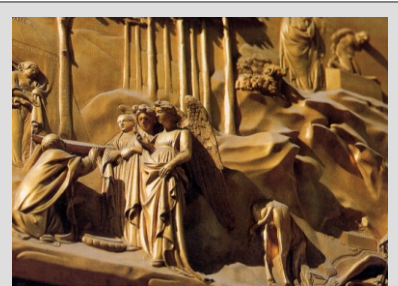
DETAJL BRONASTIH VRAT

Namestitev v hotel v mestu, večerja in nočitev. Po večerji priporočamo nočni sprehod po mestu.